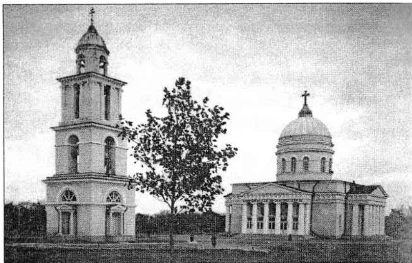
Catedrala Nașterea Domnului și clopotnița din Chișinău